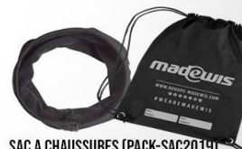
SAC A CHAUSSURES (PACK-SAC2019) CACHE COU