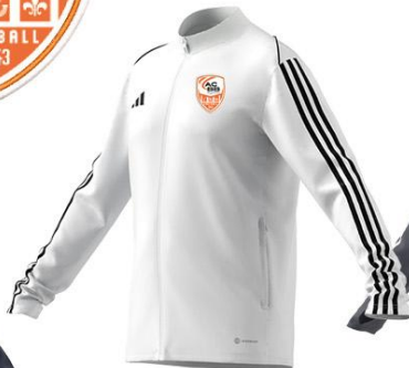
155° / 20 SEC VESTE TRAINING TIRO LEAGUE 23 ADTE02215B / HS3501 / BLANC / NOIR (BR10-XE) : XE021042-4 SEQ 1 BLANC