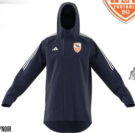
155° / 20 SEC PARKA STADIUM ADIDAS CONDIVO 22 ADTE02019B / HT2539 / MARINE/BLANC (BR10-XE) : XE021042-4 SEQ 1 BLANC