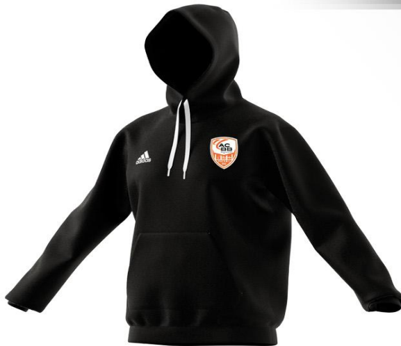
155° / 20 SEC SWEAT CAPUCHE SW ADIDAS ENTRADA 22 ADTE02050A / H57516-H57512 / NOIR/BLANC (BR10-XE) : XE021042-4