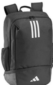
SAC A DOS TIRO 23 ADAC00900A / HS9758 NOIR / BLANC