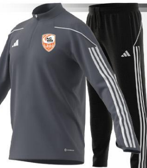
155° / 20 SEC SWEAT TRAINING TIRO LEAGUE 23 ADTE02219H / HS3491-HS0329 / ONIX/BLANC (BR10-XE) : XE021042-4 SEQ 1 BLANC