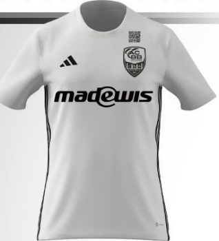
155° / 20 SEC MAILLOT SENIOR TABELA 23 ADTE02229B / H44534-H44526 / BLANC/NOIR (WB10-PAFO) : LOGO CLUB + QR CODE NOIR (MADEWIS) : NOIR