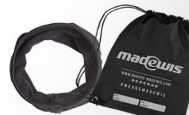
SAC A CHAUSSURES (PACK-SAC2019) CACHE COU