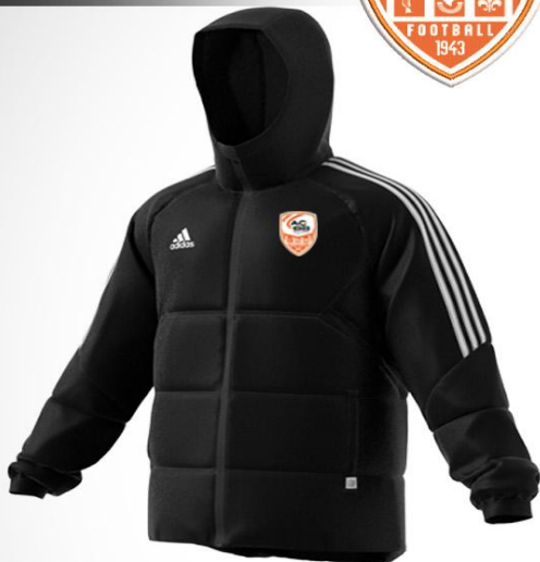
155° / 20 SEC VESTE HIVER ADIDAS CONDIVO 22 ADTE02020A / H21284-H21280 / NOIR/BLANC (BR10-XE) : XE021042-4